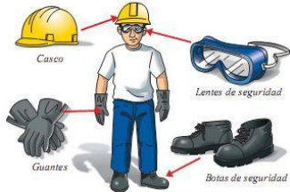
EQUIPOS DE PROTECCIÓN PERSONAL

5. Después limpiar y desinfectar, lava muy bien los elementos que usaste para el proceso. Retira los guantes después de limpiarlos y lava tus manos.